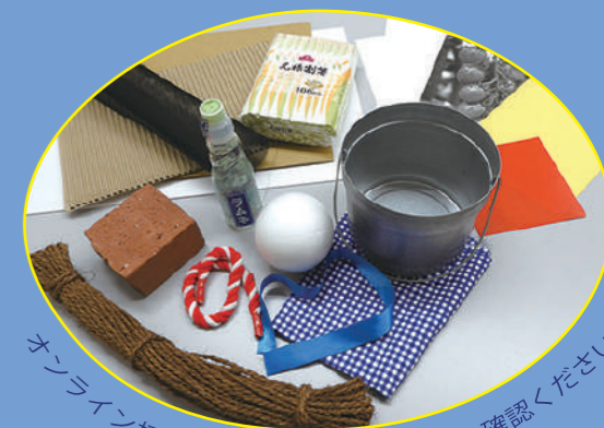
オンライン授業の詳細はパンフP.4をご確認ください。