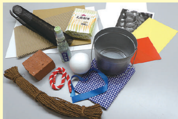
※受講の内容や期間により、実際に発送するモチーフや用紙は異なります。